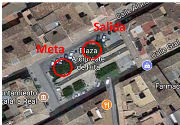
SITUACIÓN DE LA SALIDA Y LA META EN LA PLAZA DEL AYUNTAMIENTO

El casco histórico dispone de poco aparcamiento, por lo que se recomienda aparcar en la zona más nueva de la ciudad (desde el Paseo de los Álamos hacia abajo). Hay disponible un parking subterráneo en el Paseo de los Álamos, junto con zona azul alrededor del mismo y una zona con bastantes plazas en el Centro Municipal de Deporte y salud.